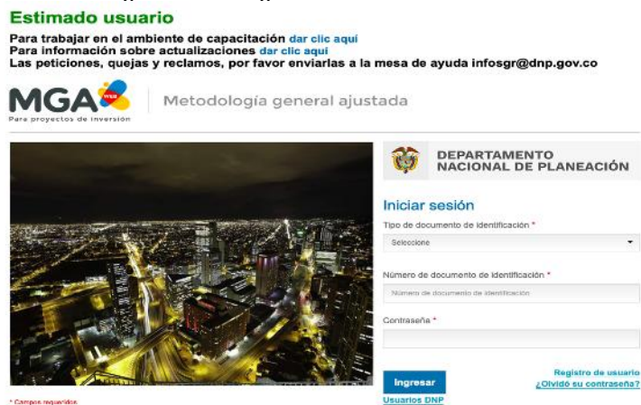
Imagen No. 1. Página de inicio de la MGA Web

El registro del proyecto modelo debe realizarse en la aplicación informática administrada por el DNP para su inclusión en el Banco Nacional de Programas y Proyectos (BPIN), a la cual se accede a través de la siguiente URL: https://mgaweb.dnp.gov.co