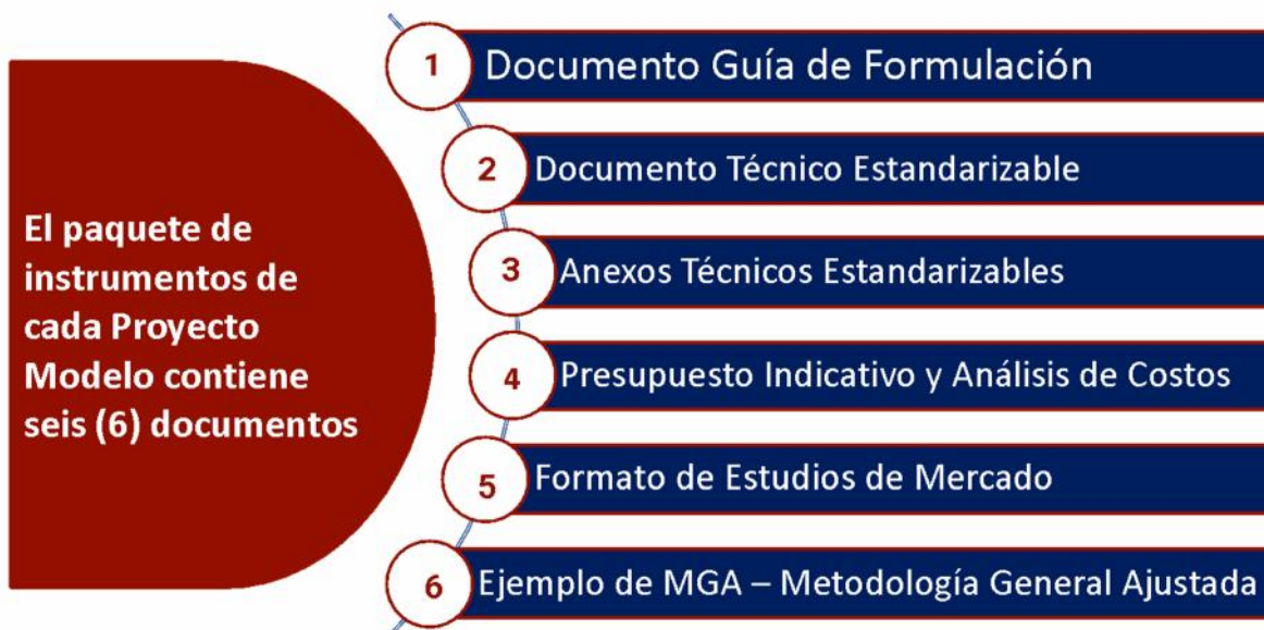
Gráfica No. 2. Paquete de Instrumentos del Proyecto Modelo