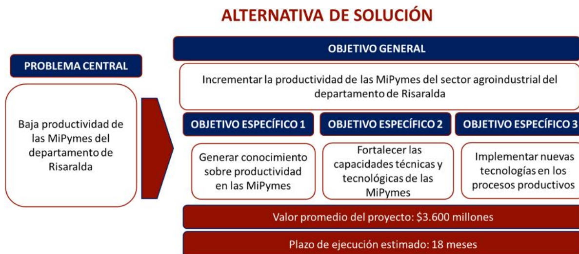
Gráfica No. 1. Alternativa de solución del Proyecto Modelo No. 2

El proyecto modelo No. 2 denominado "Implementación de acciones para fomentar la productividad que genere valor agregado a las MIPYMES del departamento de Risaralda" es una inversión estimada en $3.600 millones de pesos aproximadamente, con un panorama de ejecución de 18 meses, que atiende una problemática central identificada y una alternativa de solución que se desarrolla a partir de lo siguiente: