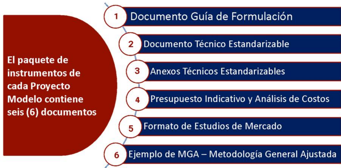
Gráfica No. 2. Paquete de Instrumentos del Proyecto Modelo