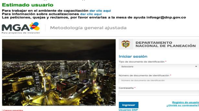
Imagen No. 1. Página de inicio de la MGA Web

El registro del proyecto modelo debe realizarse en la aplicación informática administrada por el DNP para su inclusión en el Banco Nacional de Programas y Proyectos (BPIN), a la cual se accede a través de la siguiente URL: https://mgaweb.dnp.gov.co