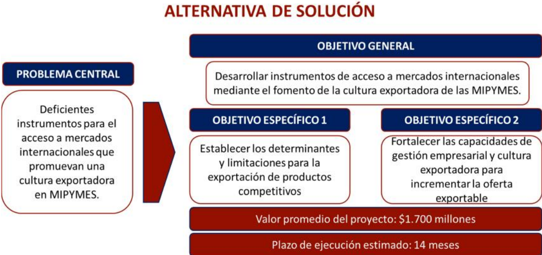
Gráfica No. 1. Alternativa de solución del Proyecto Modelo No. 4

El proyecto modelo No. 4 denominado "Implementación de estrategias para el desarrollo de mercados y el fomento de la cultura exportadora de las MIPYMES en el Departamento del Cauca" es una inversión estimada en $1.700 millones de pesos aproximadamente, con un panorama de ejecución de 14 meses, que atiende una problemática central identificada y una alternativa de solución que se desarrolla a partir de lo siguiente: